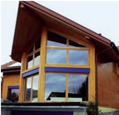
Une rénovation régulière est profitable à long terme.