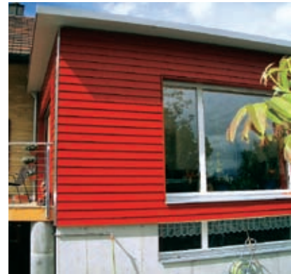
Possibilité d'obtenir des teintes couvrantes.