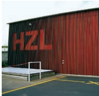
Multiples possibilités créatives.